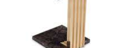
VERTIGO パーティゴ サイドテーブル

材質： 真鍮・ガラス・大理石 標準仕上げ： 真鍮（鏡面仕上げ） スモークガラス エンペラードールダークマーブル（大理石）