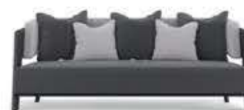
GALEA GREY ガレアGREY ソファ

材質： 木・ステンレススチール ポリロープ・ファブリック 標準仕上げ： グレイウッド ステンレススチール（磨き加工） ポリロープ（アンスラサイト色） シルバーファブリック 寸法： 幅161cm、奥行94cm、高さ80cm 座面高40cm、座面奥行53cm 重量： 57.5kg