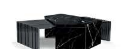
MAYER BLACK メイヤー ブラック センターテーブル

寸法： 幅121.5cm、奥行102.7cm 高さ43.1cm 重量： 201kg