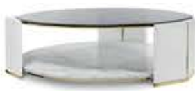
ALGERONE I BIG アルジェロン I ビッグ センターテーブル

材質： 真鍮・本革・ガラス・大理石 標準仕上げ： 真鍮（鏡面仕上げ） グレーレザー スモークガラス スタトゥアリオマーブル（大理石）