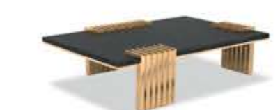
VERTIGO パーティゴ センターテーブル