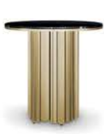
EMPIREⅢ SMALL エンバイアⅢ スモール サイドテーブル