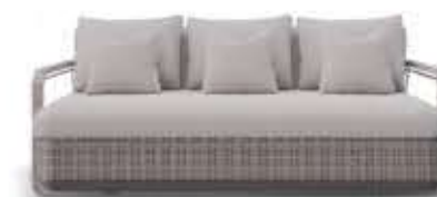
HAMPTON WOOD ハンプトンウッド ソファ

LUXXUは、屋外空間を洗練された隠れ家へと変貌させます。高級素材と洗練された美学を融合させることで、自然とエレガンスが調和したスタイリッシュな環境を創出。熟練の技で仕上げられたアイテムは、屋外での暮らしを格上げし、どんな空間にもシームレスに溶け込みます。それぞれのデザインは、ラグジュアリーと耐久性の証であり、時を超えて魅力を放ち続けます。