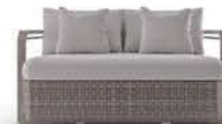
HAMPTON WOOD ハンプトンウッド ツーシートソファ

材質： 木・ステンレススチール 織り加工・ファブリック 標準仕上げ： ヴィンテージウッド ステンレススチール（磨き加工） シーシェル編み クリームカラーファブリック 寸法： 幅200cm、奥行94cm、高さ80cm 座面高40cm、座面奥行53cm 重量： 57.5kg