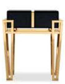
NUBIAN ヌビアン サイドテーブル

材質： 真鍮・木・ガラス 標準仕上げ： 真鍮（鏡面仕上げ） ブラックラッカー仕上げ ブラックガラス