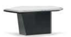
ALGERONE II SMALL アルジェロン II スモール センターテーブル

材質： 大理石・天然木 標準仕上げ： スタトゥアリオマーブル（大理石） グロス仕上げグレー・ユーカリ・フリゼ突板