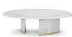
ALGERONE I SMALL アルジェロン I スモール センターテーブル

材質： 真鍮・大理石 標準仕上げ： 真鍮（鏡面仕上げ） スタトゥアリオマーブル（大理石） 寸法： 直径90cm、高さ28cm 重量： 157kg