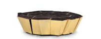
CRACKLE クラックル センターテーブル

材質： 真鍮・大理石 標準仕上げ： 真鍮（鏡面仕上げ） ブラックラッカー仕上げ エンペラードールダークマーブル（大理石）