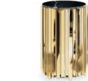
EMPIRE BIG エンバイアビッグ サイドテーブル