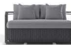
HAMPTON GREY ハンプトンGREY ツーシートソファ

材質： 木・ステンレススチール 織り加工・ファブリック 標準仕上げ： ヴィンテージウッド ステンレススチール（磨き加工） シーシェル編み クリームカラーファブリック 寸法： 幅161cm、奥行94cm、高さ80cm 座面高40cm、座面奥行53cm 重量： 57.5kg