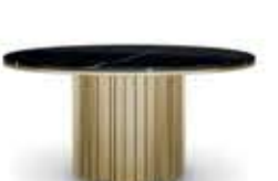
EMPIRE III MEDIUM エンパイア III ミディアム センターテーブル

材質： 真鍮・大理石 標準仕上げ： 真鍮（鏡面仕上げ） ネロマルキーナ（大理石） 寸法： 幅120cm、奥行120cm、高さ30cm 重量： 50kg