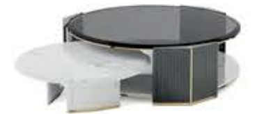
ALGERONE SET I WOOD アルジェロンセット I ウッド センターテーブル

材質： 真鍮・天然木・ガラス・大理石 標準仕上げ： 真鍮（鏡面仕上げ） グロス仕上げグレー・ユーカリ・フリゼ突板 スモークガラス スタトゥアリオマーブル（大理石）