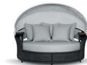
GALEA GREY ガレアGREY デイベッド

材質： 木・ファブリック 標準仕上げ： トフィーカラーファブリック 寸法： 幅206cm、奥行74cm、高さ79cm 座面高40cm、座面奥行61cm 重量： 51.2kg