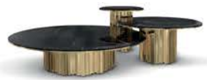
EMPIRE SET III エンパイア セット III センターテーブル

材質： 真鍮・大理石 標準仕上げ： ゴールドメッキ ネロマルキーナ（大理石） 寸法： 直径80cm、高さ40cm 重量： 72kg