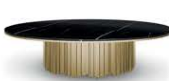
EMPIRE III BIG エンパイア III ビッグ センターテーブル

材質： 真鍮・大理石 標準仕上げ： 真鍮（鏡面仕上げ） ネロマルキーナ（大理石） 寸法： 幅120cm、奥行174cm、高さ50cm 重量： 110kg