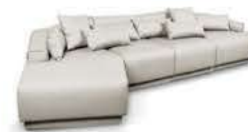
ANGIUS OUTDOOR アンギュイスアウトドア

材質： アルミニウム・ポリロープ ファブリック 標準仕上げ： カーボンパウダーコーティング ポリロープ（アンスラサイト色） セメントカラーファブリック アッシュカラーファブリック 寸法： 幅206cm、奥行74cm、高さ79cm 座面高40cm、座面奥行61cm 重量： 51.2kg