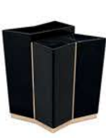
BEYOND ビヨンド サイドテーブル

材質： 真鍮・木・大理石 標準仕上げ： 真鍮（鏡面仕上げ） ブラックラッカー仕上げ ネロマルキーナ（大理石）