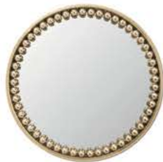
ORBIS オルビス ミラー

材質： 真鍮・鏡・クリスタル 標準仕上げ： 真鍮（槌目仕上げ） ゴールドメッキ スモークドブラックミラー アンバークリスタル 寸法： 直径94.5cm、厚さ20cm 電球： G9 LED球×6 重量： 20kg