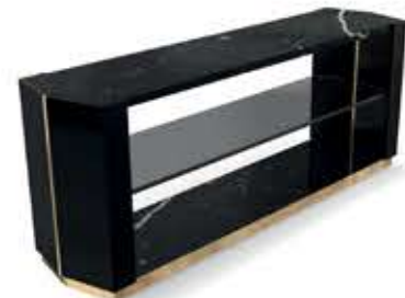
BEYOND LONG ビヨンド ロング サイドテーブル

材質： 真鍮・ガラス・木・大理石 標準仕上げ： 真鍮（鏡面仕上げ） スモークガラス ブラックラッカー仕上げ ネロマルキーナ（大理石）