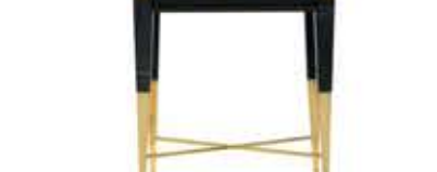
SPEAR スピア サイドテーブル

材質： 真鍮・木材・大理石 標準仕上げ： 真鍮（鏡面仕上げ） ブラックラッカー仕上げ ネロマルキーナ（大理石）