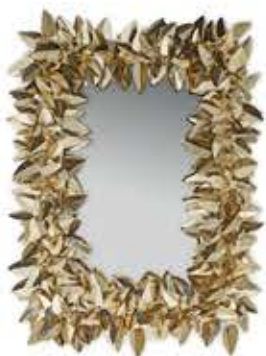
MCQUEEN RECTANGULAR マックイーン レクタングラー ミラー

材質： 真鍮・鏡・クリスタルガラス 標準仕上げ： ゴールドメッキ スモークドブラックミラー 寸法： 直径117cm、厚さ6.5cm 重量： 48kg