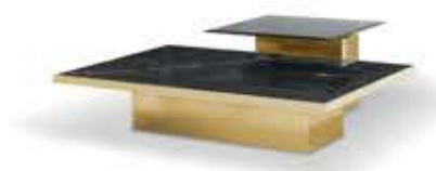
THOR トール センターテーブル

材質： 真鍮・木材・ガラス・大理石 標準仕上げ： 真鍮（鏡面仕上げ） ブラックラッカー仕上げ スモークガラス ネロマルキーナ（大理石）