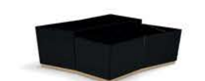
BEYOND ビヨンド センターテーブル

材質： 真鍮・木材・大理石 標準仕上げ： 真鍮（鏡面仕上げ） ブラックラッカー仕上げ ネロマルキーナ（大理石）