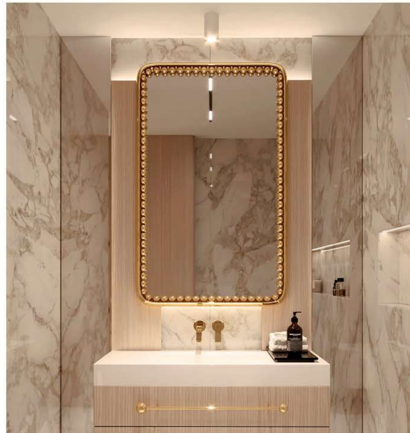
ORBIS RECTANGULAR オルビス レクタングラー ミラー

材質： 真鍮・鏡 標準仕上げ： 真鍮（鏡面仕上げ） スモークドブラックミラー 寸法： 直径101.3cm、厚さ9.1cm 重量： 58kg