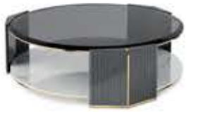
ALGERONE I WOOD BIG アルジェロン I ウッドビッグ センターテーブル

材質： 真鍮・天然木・ガラス・大理石 標準仕上げ： 真鍮（鏡面仕上げ） グロス仕上げグレー・ユーカリ・フリゼ突板 スモークガラス スタトゥアリオマーブル（大理石）