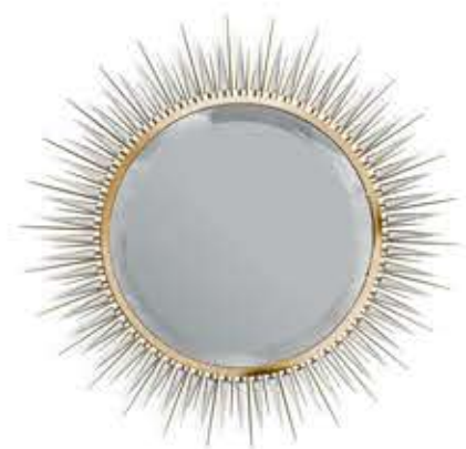
EXPLOSION XL エクスプロージョンXL ミラー

材質： 真鍮・鏡・クリスタルガラス 標準仕上げ： ゴールドメッキ スモークドブラックミラー 寸法： 直径90.1cm、厚さ6.5cm 重量： 27kg