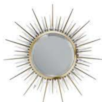
EXPLOSION エクスプロージョン ミラー

材質： 真鍮・鏡 標準仕上げ： ゴールドメッキ スモークドブラックミラー 寸法： 直径135cm、厚さ7.2cm 重量： 82kg