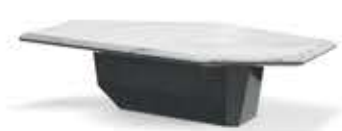
ALGERONE II BIG アルジェロン II ビッグ センターテーブル

材質： 大理石・天然木 標準仕上げ： スタトゥアリオマーブル（大理石） グロス仕上げグレー・ユーカリ・フリゼ突板