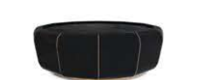
DARIAN ダリアン センターテーブル

材質： 真鍮・木材・大理石 標準仕上げ： 真鍮（鏡面仕上げ） ブラックラッカー仕上げ ネロマルキーナ（大理石）