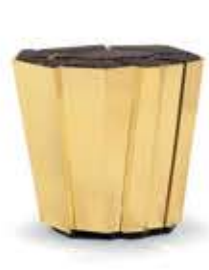
CRACKLE クラックル サイドテーブル

材質： 真鍮・大理石 標準仕上げ： 真鍮（鏡面仕上げ） ブラックラッカー仕上げ エンペラドール・マーブル（大理石）