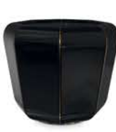
DARIAN ダリアン サイドテーブル

材質： 真鍮・木・大理石 標準仕上げ： 真鍮（鏡面仕上げ） ブラックラッカー仕上げ ネロマルキーナ（大理石）