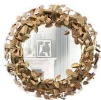
MCQUEEN マックイーン ミラー

材質： 真鍮・鏡・クリスタル 標準仕上げ： 真鍮（槌目仕上げ） ゴールドメッキ スモークドブラックミラー アンバークリスタル 寸法： 幅76cm、高さ106cm、厚さ13cm 重量： 40kg