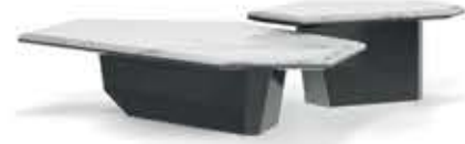
ALGERONE SET II アルジェロンセット II センターテーブル

材質： 真鍮・大理石 標準仕上げ： 真鍮（鏡面仕上げ） スタトゥアリオマーブル（大理石） 寸法： 直径90cm、高さ28cm 重量： 157kg