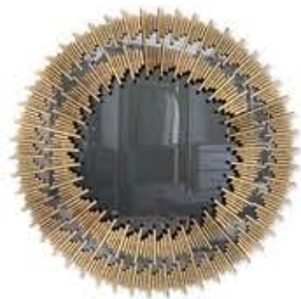
SCALA スカラ ミラー

材質： 真鍮・鏡 標準仕上げ： ゴールドメッキ スモークドブラックミラー 寸法： 直径135cm、厚さ7.2cm 重量： 82kg