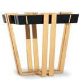
APOTHEOSIS アポテオシス サイドテーブル

材質： 真鍮・木・大理石 標準仕上げ： 真鍮（鏡面仕上げ） ブラックラッカー仕上げ エンペラドール・マーブル（大理石）