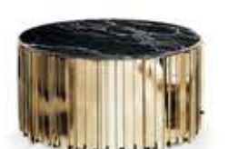
EMPIRE エンパイア センターテーブル

材質： 真鍮・大理石 標準仕上げ： ゴールドメッキ ネロマルキーナ（大理石） 寸法： 直径80cm、高さ40cm 重量： 72kg