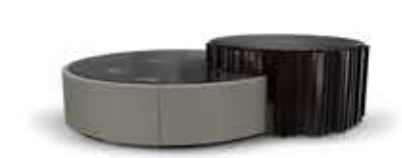
EMPIRE SET I エンバイアセットⅠ センターテーブル

材質： 真鍮・大理石・合成皮革 標準仕上げ： 真鍮（ブロンズ調仕上げ） エンペラードールダークマーブル（大理石） エラストンレザー