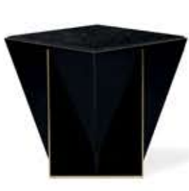
PRISMA プリズマ サイドテーブル

材質： 真鍮・木・大理石 標準仕上げ： 真鍮（鏡面仕上げ） ブラックラッカー仕上げ ネロマルキーナ（大理石）