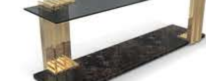
VERTIGO LONG パーティゴ ロング サイドテーブル

材質： 真鍮・ガラス・大理石 標準仕上げ： 真鍮（鏡面仕上げ） スモークガラス エンペラードールダークマーブル（大理石）