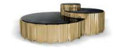
EMPIRE SET II エンバイアセットⅡ センターテーブル