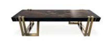
APOTHEOSIS アポテオシス センターテーブル

材質： 真鍮・木材・大理石 標準仕上げ： 真鍮（鏡面仕上げ） ブラックラッカー仕上げ エンペラードールダークマーブル（大理石）