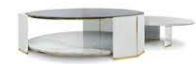
ALGERONE SET I アルジェロンセット I センターテーブル

材質： 真鍮・本革・ガラス・大理石 標準仕上げ： 真鍮（鏡面仕上げ） グレーレザー スモークガラス スタトゥアリオマーブル（大理石）