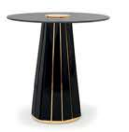
DARIANⅡ ダリアンⅡ サイドテーブル

材質： 真鍮・ガラス・木 標準仕上げ： 真鍮（鏡面仕上げ） ブラックラッカー仕上げ スモークガラス