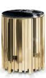
EMPIRE SMALL エンバイア スモール サイドテーブル