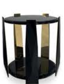
INPERIUM インペリウム サイドテーブル

材質： 真鍮・木・大理石 標準仕上げ： 真鍮（鏡面仕上げ） ブラックラッカー仕上げ ネロマルキーナ（大理石）