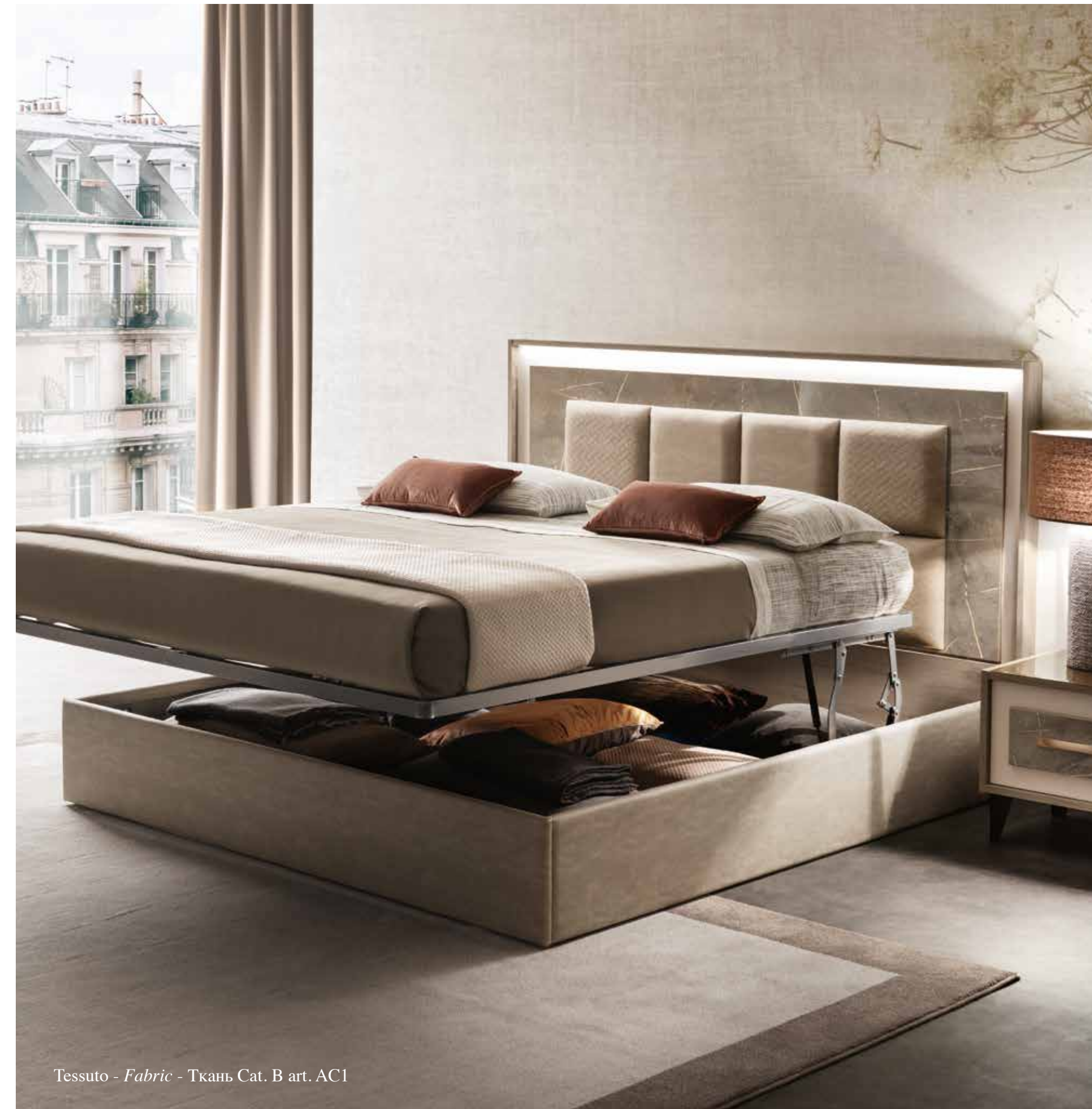
Tessuto - Fabric - Ткань Cat. B art. AC1