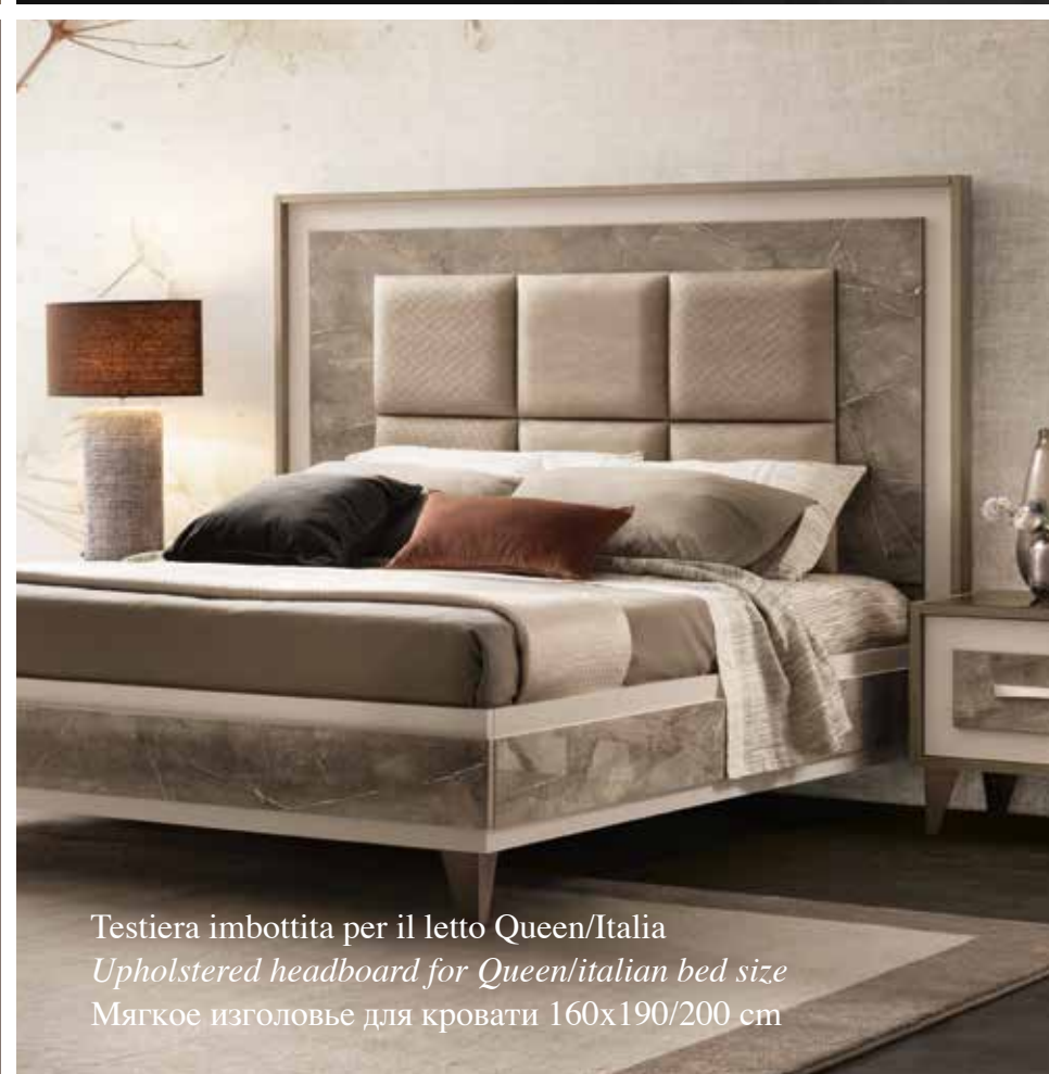
Testiera imbottita per il letto Queen/Italia Upholstered headboard for Queen/italian bed size Мягкое изголовье для кровати 160x190/200 cm

Кровать, «царица» ночной зоны, предлагается в версиях с ящиком для хранения и контейнером. Ночные столики комплектуются одним большим выдвижным ящиком и внутренней выдвижной полкой, на которой можно хранить наиболее ценные предметы. Благородный элемент, свидетельствующий о тщательной проработке деталей: внутренняя часть ящика обтянута мягким бархатом. функциональный и элегантный предмет мебели в любом варианте исполнения.