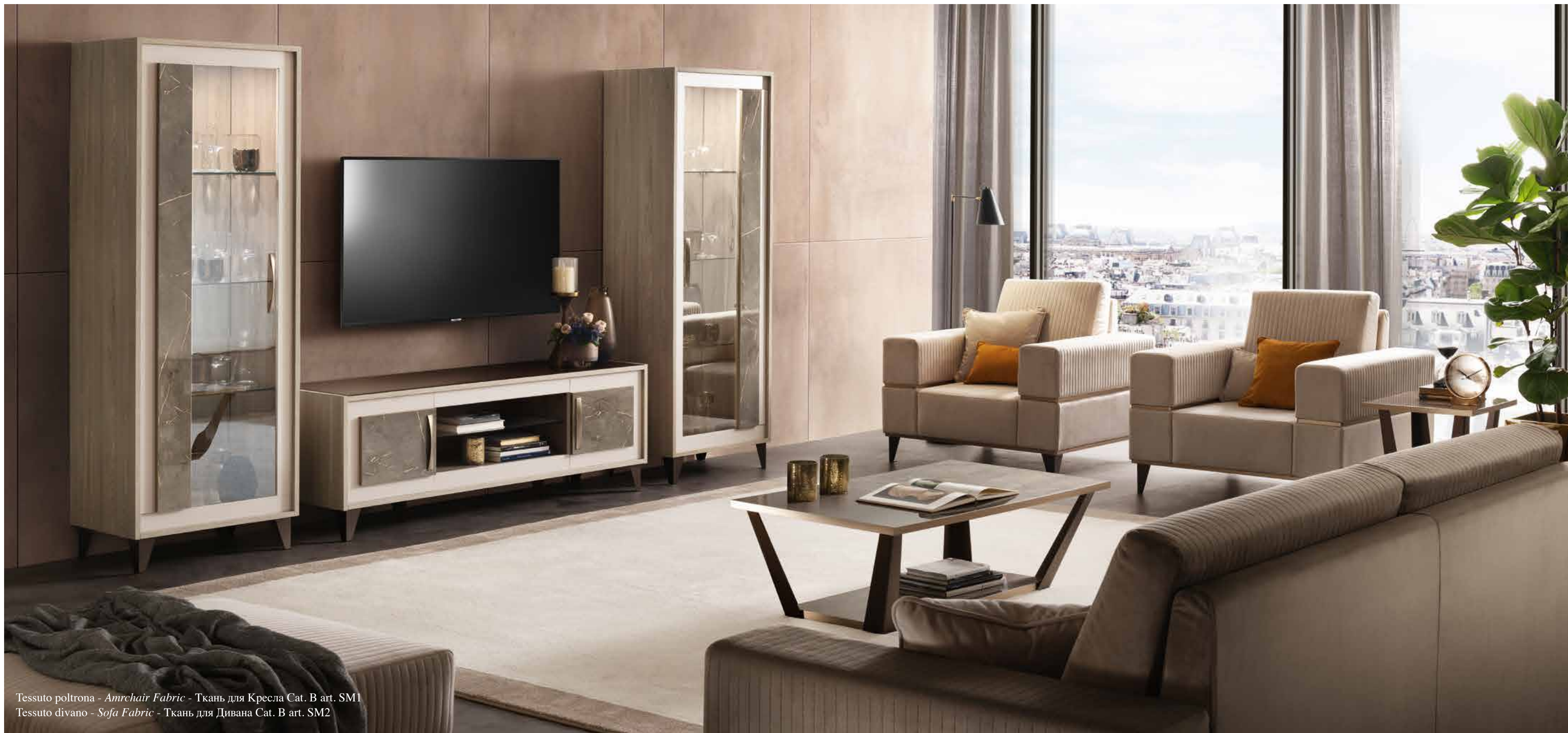
Tessuto poltrona - Armchair Fabric - Ткань для Кресла Cat. B art. SM1 Tessuto divano - Sofa Fabric - Ткань для Дивана Cat. B art. SM2